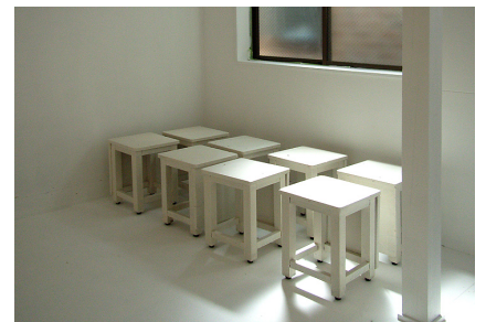
中古の図工室の椅子もすべて白色に