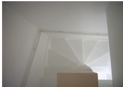
白が微かな陰影を生み出す階段室