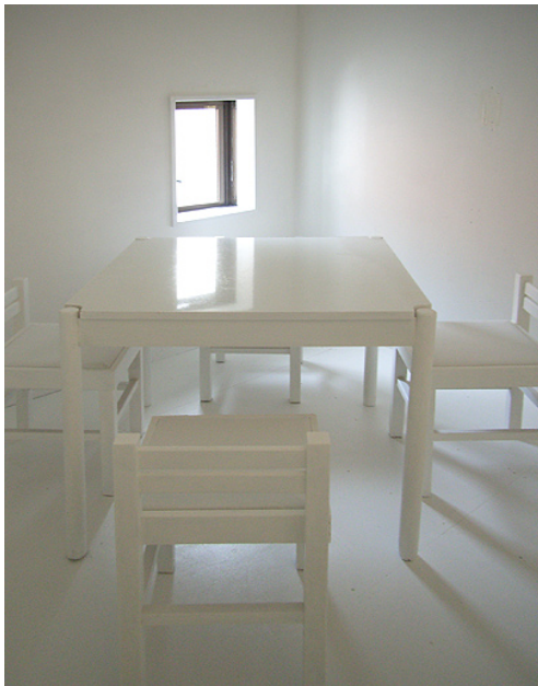
家具も床もすべてが白で統一された空間