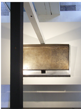
吹抜けから眺める鉄板