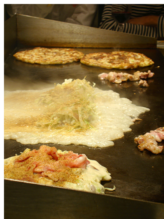
ミソラ焼（各種）ととろとろ焼き