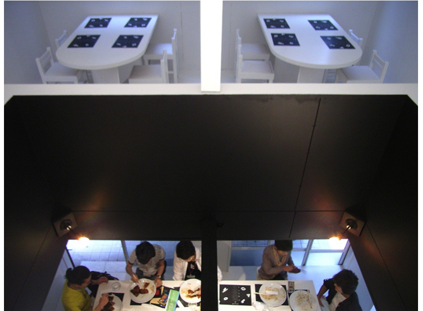
吹抜け部分から1階を覗き込む

鳥取県宍粟発祥の鉄板焼き「美空」。 「美空」の料理人が調理し、仕上げる「ミソラ焼」、 それを引き立てる「空間」、 そしてそれを「食べる」あなた。 美の回りにあるいつもの材料＝「日常」から生まれる感動を ヒガシノミソラで体感してください。